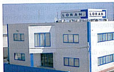
UN ESTERNO DELL'AZIENDA

ture idonee. Il gruppo fornisce anche servizi post vendita, con formazione del personale. Loran si candida inoltre come partner nella progettazione e produzione di software per la gestione dei reparti ospedalieri: dall'accettazione alla dimissione del paziente con cartella clinica informatizzata. Le soluzioni software proposte da Loran sono realizzate nel rispetto di tutti gli standard nazionali e internazionali.