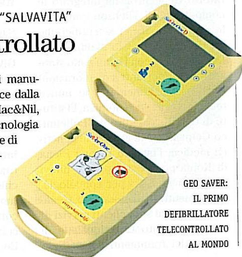
GEO SAVER: IL PRIMO DEFIBRILLATORE TELECONTROLLATO AL MONDO

i MAC&NIL SRL GRAVINA IN PUGLIA - TEL. (+39) 080 2464245